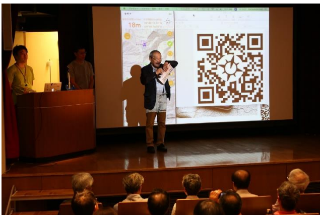
開会挨拶とともに JAMC の紹介をする恵代表