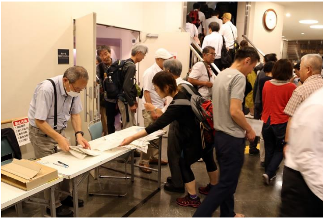
閉会后、会場出口でアンケートを回収

反省点として、満足いただけなかった方々は概ね高齢者でスマホ操作に不慣れでした。今後の講演会企画や募集に際し、改善の余地があります。 以上