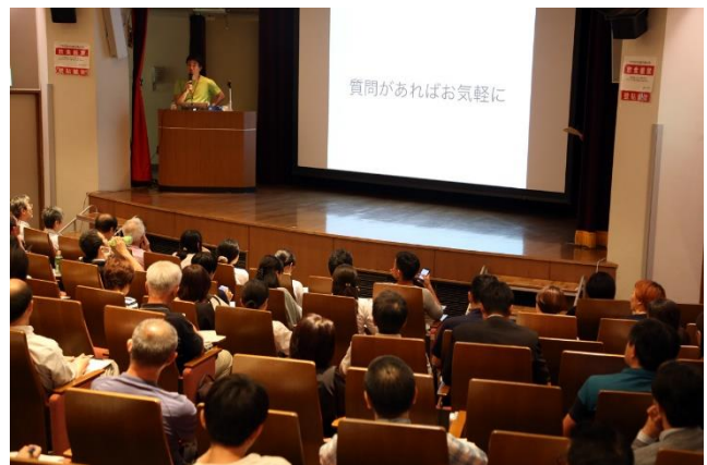
講演会最後、出席者から多くの質疑が出た